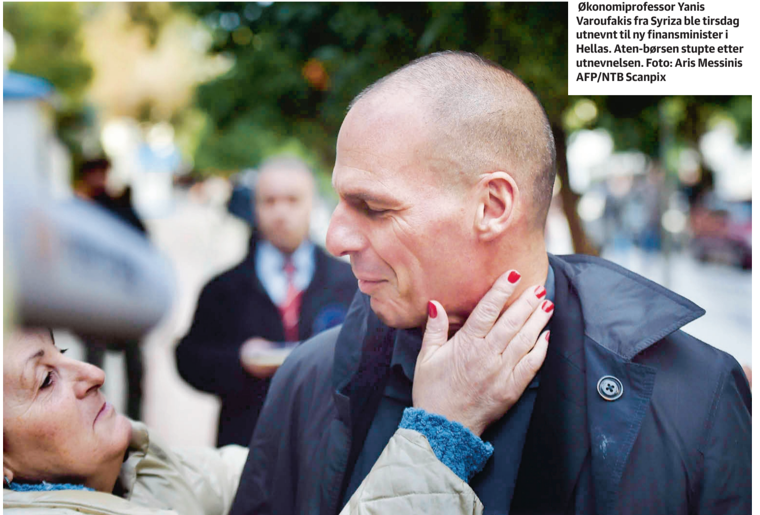
Økonomiprofessor Yanis Varoufakis fra Syriza ble tirsdag utnevnt til ny finansminister i Hellas. Aten-børsen stupte etter utnevnelsen.