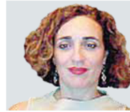
ΤΗΣ ΣΤΕΛΛΑΣ ΛΑΔΗ

περιφέρεια – είτε αυτές έχουν προκληθεί από λάθος εθνικούς ή ευρωπαϊκούς χειρισμούς και πολιτικές είτε οφείλονται σε εξωγενείς παράγοντες και στη δυναμική των παγκόσμιων εξελίξεων. Είτε, τέλος,